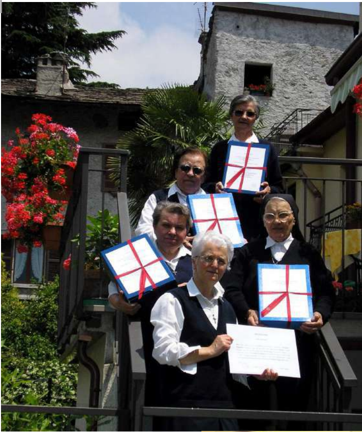
Roma 2006: Atti del Processo diocesano nella Casa Provinciale