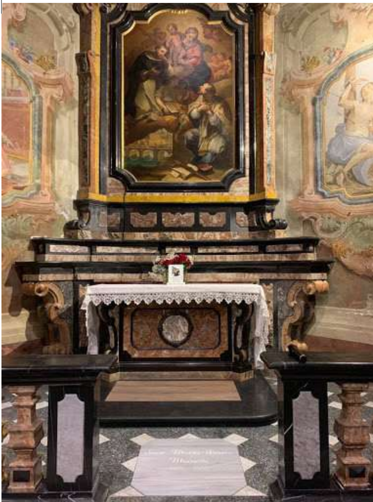
Chiavenna 26 febbraio 2019: traslazione della Serva di Dio nella Collegiata di San Lorenzo