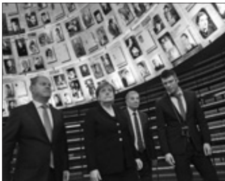
Merkel allo Yad Vashem

Merkel, giunta ieri in Israele, parteciperà oggi a una tavola rotonda di imprenditori tedeschi e israeliani e sarà ricevuta dal presidente israeliano Reuven Rivlin. A seguire, l'in-