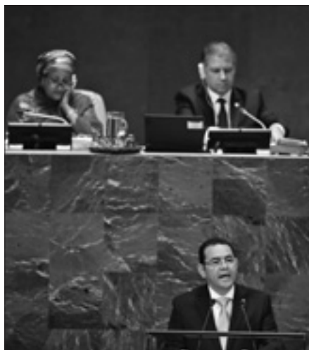
Il presidente Morales durante il suo intervento all'Assemblea generale delle Nazioni Unite

CITTÀ DEL GUATEMALA, 4. Si acuisce il braccio di ferro fra il presidente guatemalteco, Jimmy Morales, e la commissione internazionale contro l'impunità in Guatemala (Cicig) sostenuta dalle Nazioni Unite.