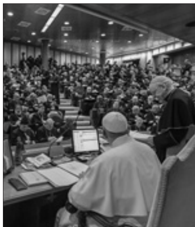
Padre per il 50° del sinodo dei vescovi.

Sin dall'inizio di questo pontificato, la Segreteria generale del sinodo dei vescovi, per espressa volontà di Papa Francesco, ha intrapreso un lungo cammino di revisione dell'istituzione e in particolare della metodologia sinodale. Questo processo di revisione è stato coronato dalla promulgazione della suddetta costituzione