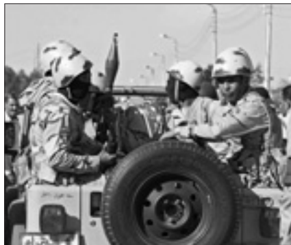
Ucciso un leader del gruppo jihadista