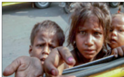
Bambini a Caracas