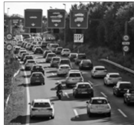
Traffico nei pressi di Ginevra

L'associazione dei costruttori auto europei si sono detti fortemente contrari, mentre l'Associazione dell'industria elettrica (Eurelectric) ha sottolineato la lungimiranza della presa di posizione dell'Europarlamento. Determinante potrebbe essere l'Austria, che sembra voglia proporre una posizione di compromesso per chiudere un accordo prima della fine del suo semestre di presidenza. Il Partito popolare austriaco, al governo nel paese, fa parte del Partito popolare europeo (Ppe) che ieri ha presentato un emendamento - poi bocciato dall'aula - per contenere il taglio al 35 per cento. Ma anche questo target po-